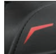
GÜK mit versenkten Nähten