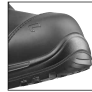
HAIX® Composite Schutzkappe