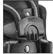
HAIX® Fast Lacing Fit System